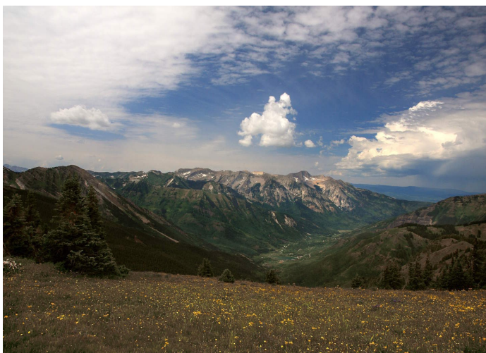
Annexe 1 : Vallée du Centre Etude de l'Environnement