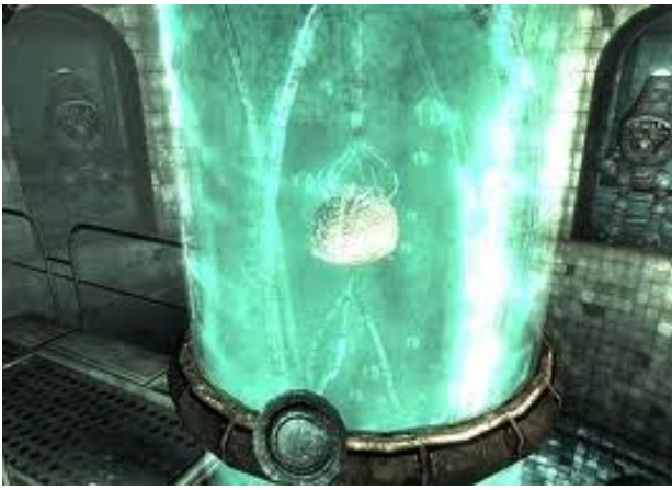
Annexe : 5 « Le Cerveau » dans sa cuve