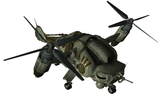
Vertiptère de la Confrérie De l'Acier