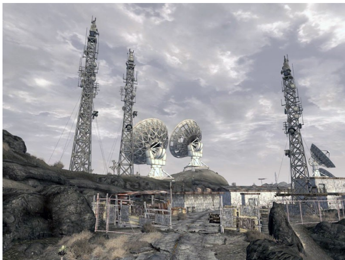
Annexe 2 : Station Radio de Pine Bluff