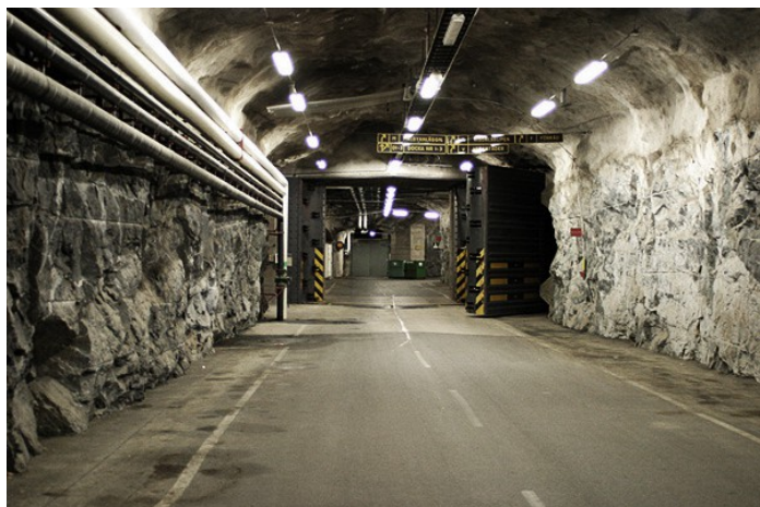
Annexe 3 : Premier couloir de la base de la CRD